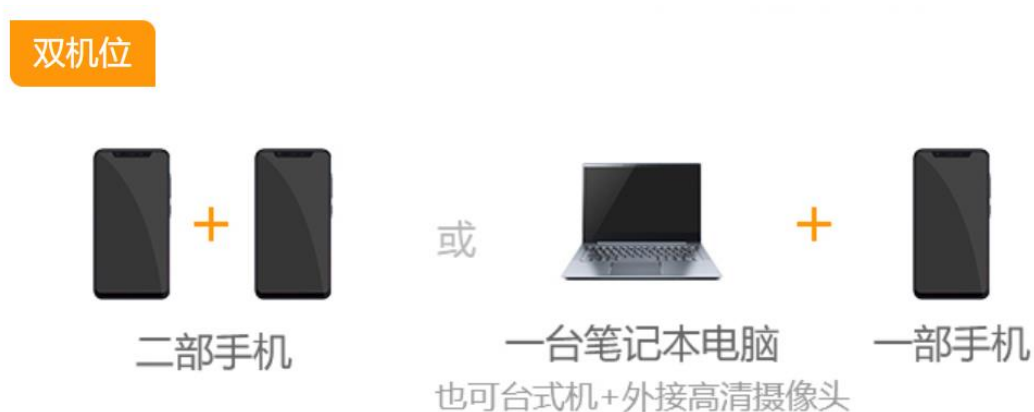
图 2 双机位的组成

注意：一机位可以使用电脑、笔记本、手机，二机位必须使用手机，且该手机需确保考前安装并登录学信网 APP，以备顺利进行二机位扫码登录。