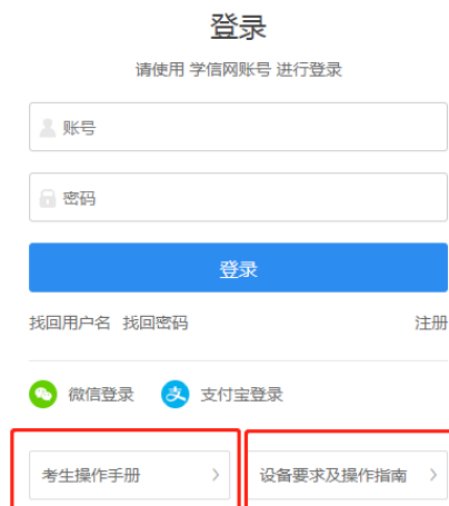
图 1 操作手册下载位置