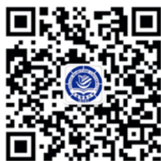
海大官方微信二维码