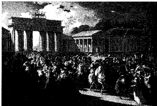
拿破仑进入勃兰登堡门(油画)